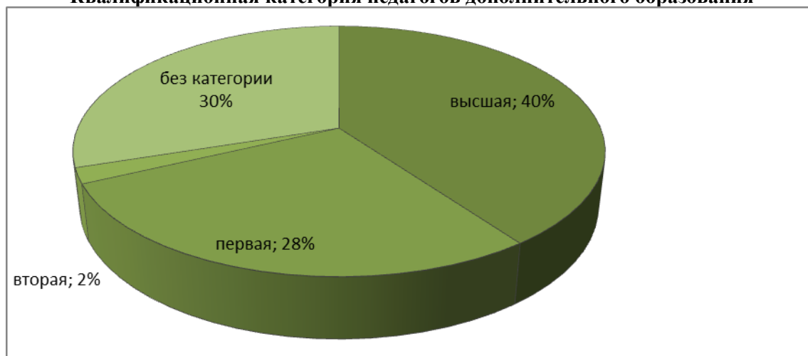
Квалификационная категория педагогов дополнительного образования